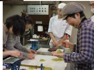
伝統と遊びツアー 柏屋葛城堂/ 和菓子作りを体験

参加者自身が体験できるプログラムに對して特に高評価をいただきました。また当地区の店舗を初めて利用される方が半数を占める中、参加者の方すべてに当地区店舗への再訪問のご希望もいただきました。参加店舗からも訪問のきっかけや、自身の勉強になったとの感想の他、一方通行でないコミュニケーションを次回回は心がけたいと反省もありました。