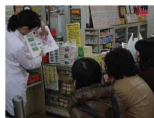
ライフスタイルツアー ミナミ薬局/ 血液、漢方に関する 話を紙芝居で紹介

今回は「ライフスタイルツアー」「伝統と遊びツアー」の2コースを実施し、お子様2名を含む18名の方にご参加いただきました。参加者の方にはツアー全体に対し概ね好評でしたが、その中でも