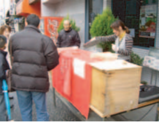
本町通商店会のお雑煮