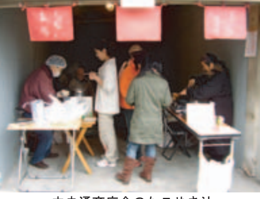
中央通商店会のたこやき汁