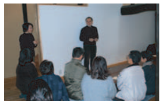
「くるま座」での勉強風景

1月14日(水)、第4回「商店街にぎわい部会」を開催し、駅前・楠公・中央・本町商店街における空き店舗調査の結果報告を行いました。今後、他地区の事例等を勉強しながら、空き店舗活用方向について検討していきます。 『駅前の顔づくりプロジェクト・チーム』では、大阪商業振興センターの商店街等活性化プロジェクト事業を活用し、駅前の活性化に向けたコンセプトと取り組み方向について議論を重ねています。