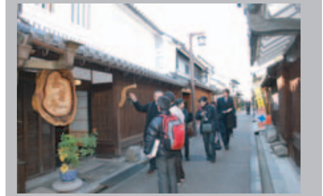
「奈良県今井町・奈良町」空家等活用事例見学会(今井地区)

1月28日(水)、空家・空き店舗の活用事例について勉強するため、今井町、奈良町周辺に見学に行ってきました。今井町ではNPO法人今井まちなみ再生ネットワークにお話を伺った後、またあるきをし、奈良町では奈良町文化館「くるま座」、町家複合ショップ「界」、もちいどのセンター街「もちいどの夢キューブ」を見学しました。