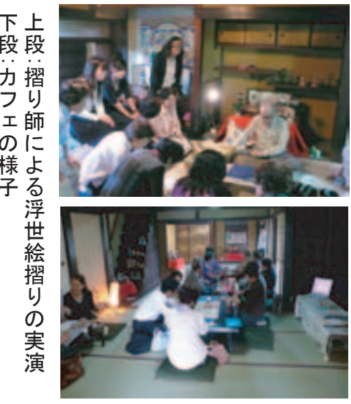
上段・摺り師による浮世絵摺りの実演

四季折々に開催する『寺内町四季物語二〇〇九』では、準備や当日の運営スタッフを随時募集しています! ご関心のある方は事務局、協議会役員、もしくは下記連絡先までご連絡下さい ●事務局支援コンサルタント: ㈱ダン計画研究所 ●連絡先: 06-6944-1173(担当: 新田・柴田・山下)