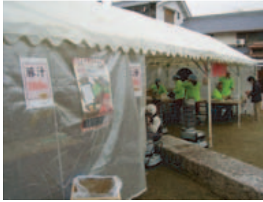
三和通商店会の豚汁